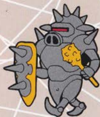
むじか 無敵アーマー